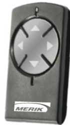
Transmisor de 4 canales