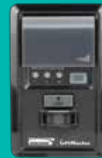
Panel de Control con Detector de Movimiento